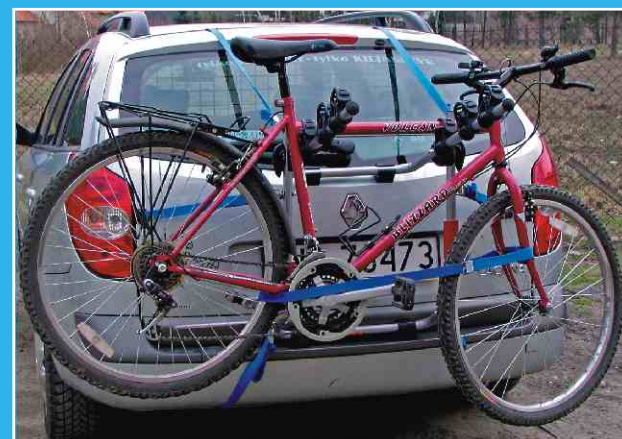
do wszelkich typów nadwozi